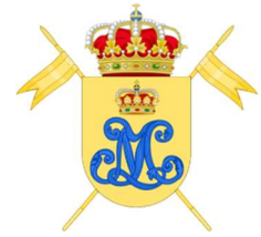
"Húsares de la Princesa"

Dos Cabos de Caballería, de la misma quinta y realizando un hecho heroico similar.