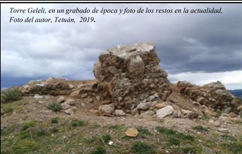
Torre Geleli, en un grabado de época y foto de los restos en la actualidad, Foto del autor, Tetuán, 2019.