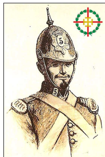
Cabo Pedro Castillo y Ramirez

Ante la amenaza que suponía para el ejército del Sultán la construcción del reducto llamado " La Estrella ", situado entre el campamento español del Fuerte Martín (Río Martín en la actualidad) y la Torre Geleli (campamento y posición enemiga), el ejército moro inicia a hostigar el reducto con el fin de dificultar su construcción. El 23 de Enero de 1860 el Batallón de Cazadores de Cantabria, que se encontraba proporcionando seguridad al citado reducto es asediado por la caballería del Sultán Marroquí, en ese momento el General O'Donnell ordena romper el cerco enemigo con los 1º y 2º escuadrón del Farnesio nº 5, más una sección de Cazadores del Abuera y la Guardia Civil que era su escolta.