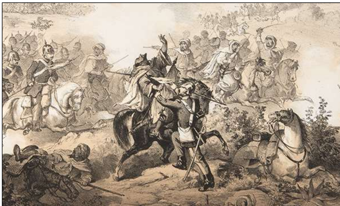
Grabado de época de la acción del 23 de enero, donde aparece el Cabo del Castillo, en la ciénaga de Tetuán.

El Sargento Castillo se licenció en julio de 1860, concediéndole un estanco en su pueblo, más tarde ocuparía el cargo de alcalde de Villarobledo, donde falleció en 1894.