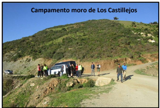
Valle de Tetuán desde la Torre Geleli y del campamento Moro de Castillejos actualmente, Fotos del Autor y Luis Pérez, 2019