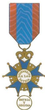
Medalla de Benemérito de la Patria

Por su distinguido comportamiento durante las operaciones para levantar el sitio de Bilbao, en noviembre-diciembre de 1836, le fue concedida la segunda Cruz de San Fernando , esta de 3ª Clase, por Real Orden de 14 de febrero de 1837. Siendo nombrado, Benemérito de la Patria.