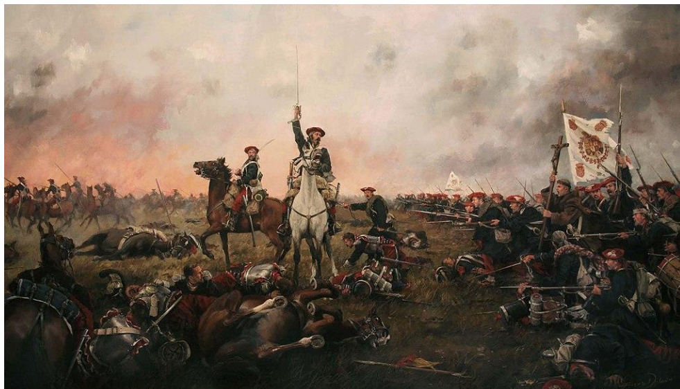
Cuadro "Calderote", (Primera Guerra Carlista) por Ferrer Dalmau

Fue un gran militar con una extensísima Hoja de Servicios, que participó en numerosas acciones militares. Sirvió en la Guerra de la Independencia contra los franceses (1808-1814) y en la primera Guerra Carlista (1833-1840).