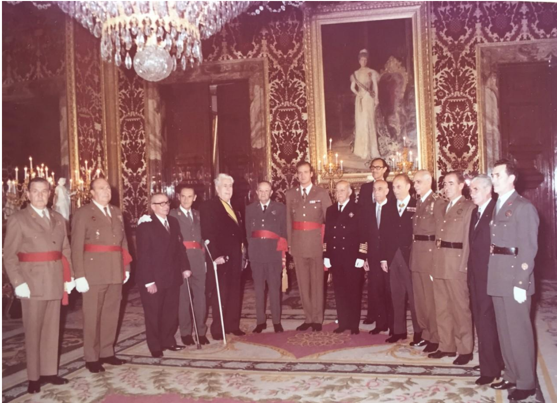
Recepción de S.M. El Rey a los laureados.

En 15 de junio de 1962, se le concede la Gran Cruz de la Real y Militar Orden de San Hermenegildo, con antigüedad de 12 de febrero.