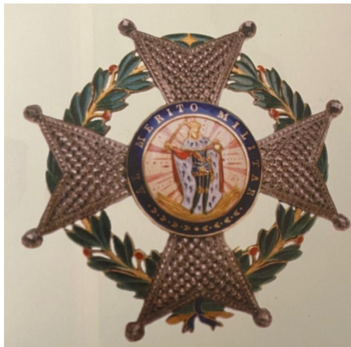
Gran Cruz Laureada de San Fernando

Recibió la Gran Cruz de las Órdenes de Isabel la Católica, San Hermenegildo, la de Espada (Suecia), el Collar de la Insigne Orden de la Torre y Espada de Portugal, la de Cambodge (Camboya), etc.