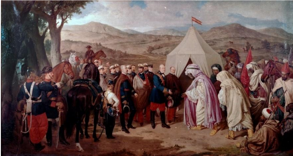
Foto: La Paz de Wad-Ras. Museo del Ejército.

Entre O'Donnell y Muley el Abbás, (hermano del sultán).