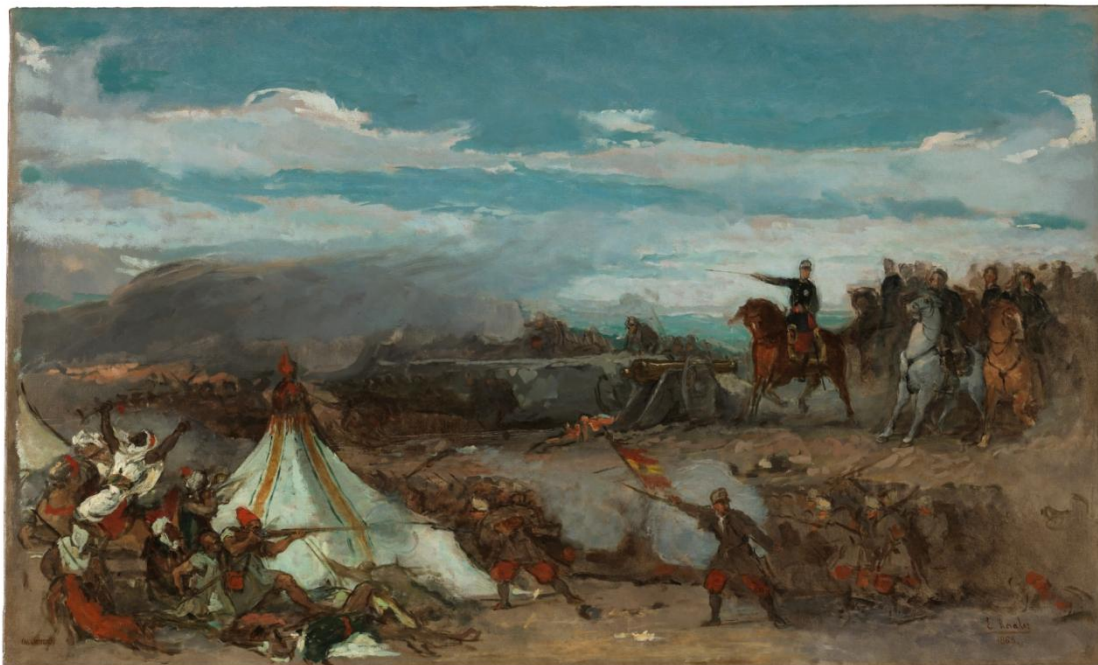
Foto: La Batalla de Tetuán 1860. Museo del Prado.