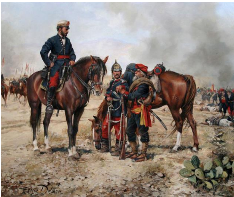
Lienzo del General Prim junto a un voluntario Catalán. obra de Ferrer Dalmau.