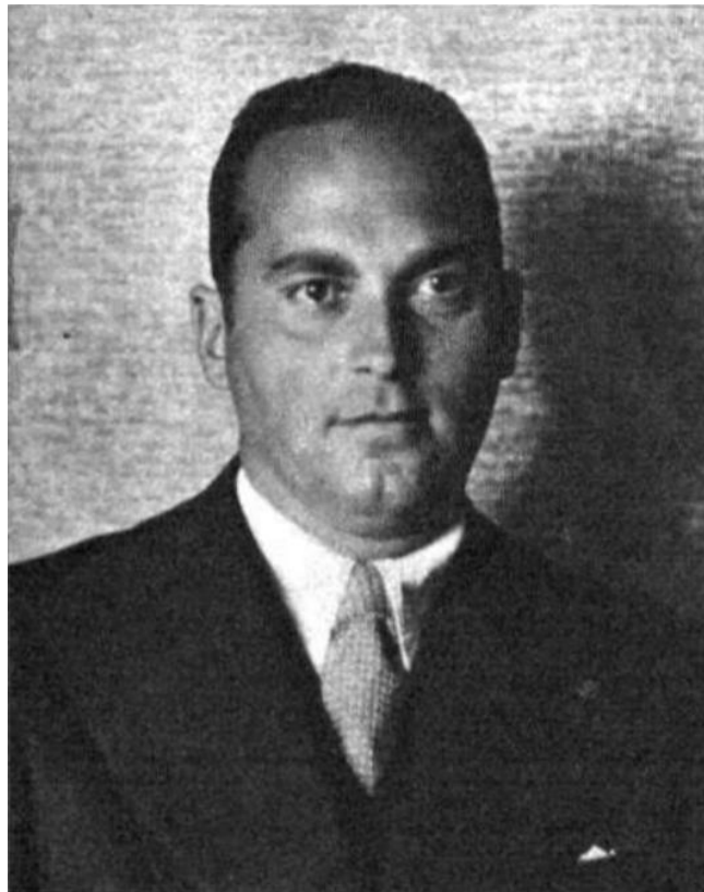
Antonio Nombela en 1935.

Sobrevivió Nombela a la gravísima herida y, después de diez meses en el hospital, se reincorporó al Servicio de Aviación. Realizó un considerable número de misiones de guerra, en una de las cuales, llevada a cabo el 4 de Julio de 1926, en apoyo de la columna del entonces comandante Osvaldo Capaz , su fue avión derribado y hubo de posarse en el mar, nadando hasta la costa, enemiga, y por ella alcanzar las avanzadillas españolas. Ascendió a capitán en 1927, realizó el curso de piloto y prestó servicio en distintas unidades de la península.