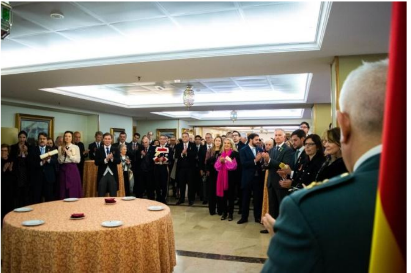
Parte de los invitados, en el coctel